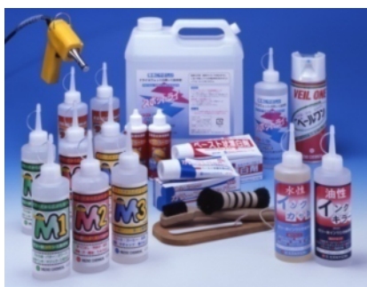
クリーニング向け 業務用シミ抜き剤各種