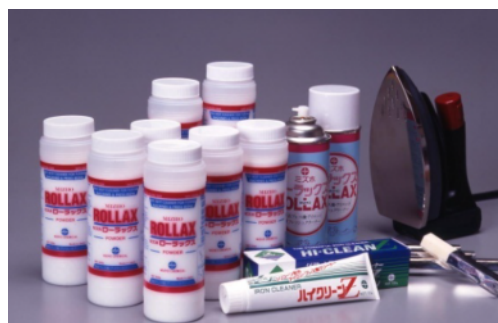
世界の縫製工場向け 接着芯地樹脂除去剤