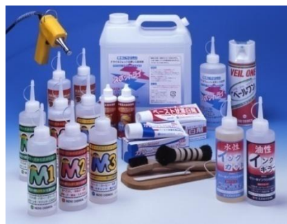
クリーニング向け 業務用シミ抜き剤種