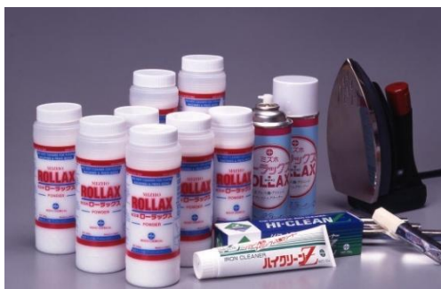
世界の縫製工場向け 接着芯地樹脂除去剤